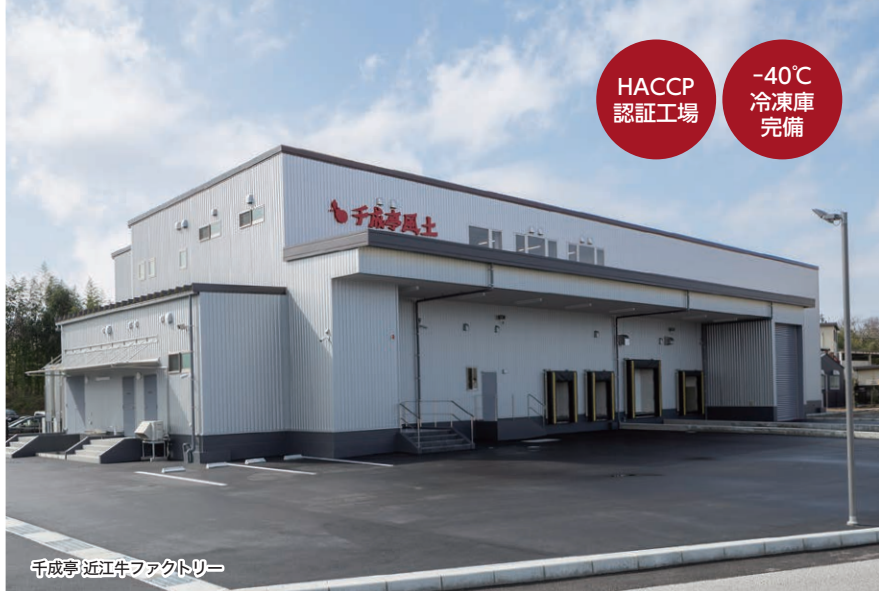
千成亭 近江牛ファクトリー

そして、すべてのお客様と「企業対顧客」ではなく 「人対人」の温かい関係を築いていけたらと願っています。